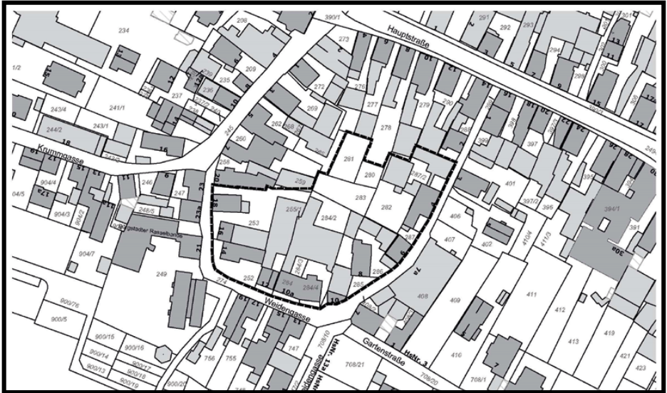
Lageplan, ohne Maßstab